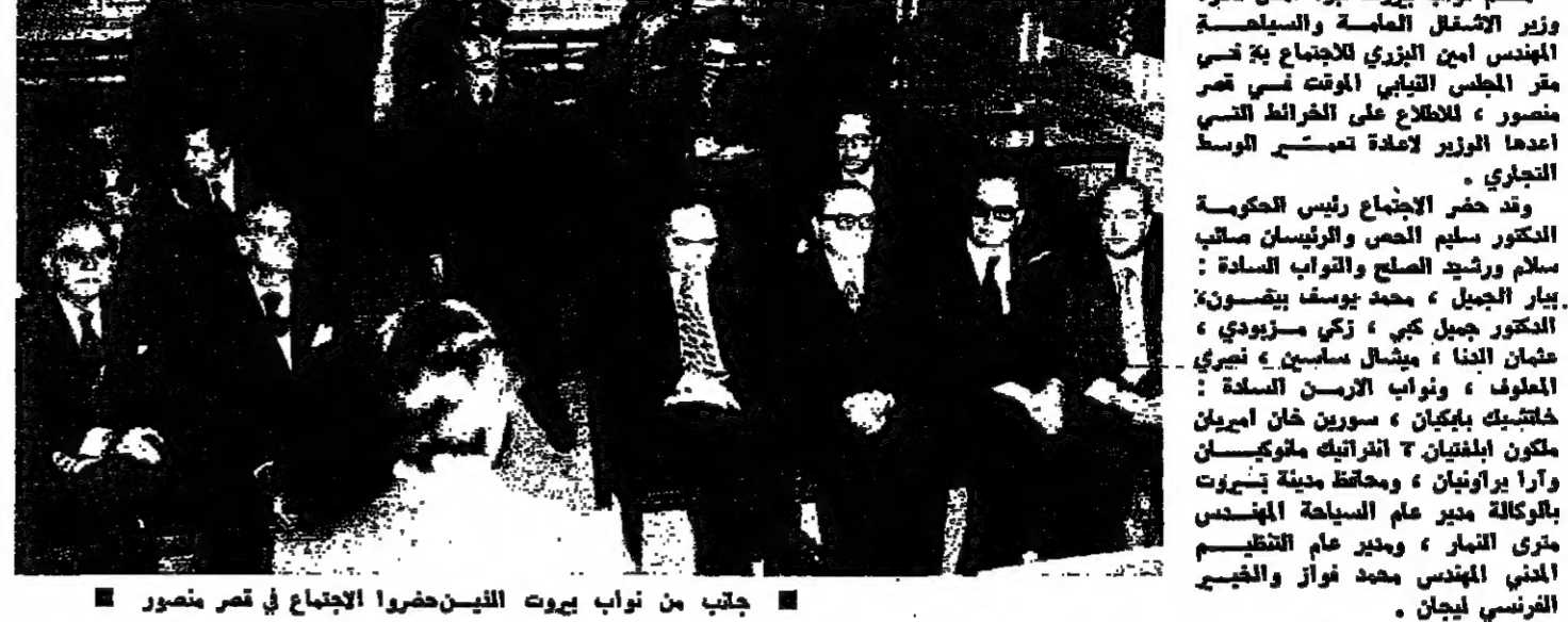
جانب من تواب بيروت الذين حضروا الاجتماع في قصر منصور